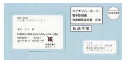
▲有効期限通知書の封筒

同封のパンフレットをご一読のうえ、 余裕をもってお早め にお住いの市区町村窓口で更新手続きをお願いします。 なお、電子証明書の有効期限が切れても、お住いの市区町村窓口で手続きを行うことで再発行できます。 ※電子証明書の更新と再発行の手続きはオンラインではできません。