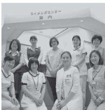
婦人科検診の対応は全員女性スタッフです。