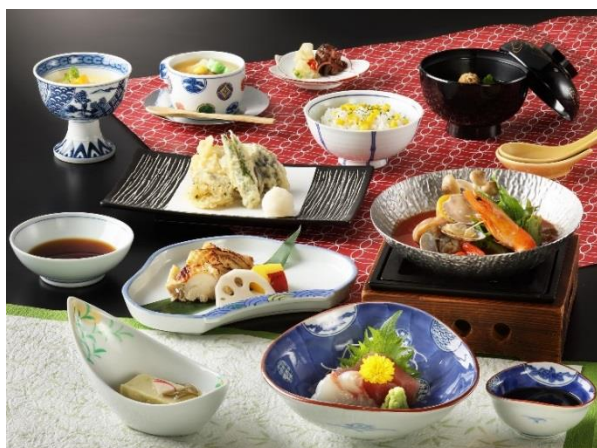
夕食: 団体プラン専用コース (イメージ)

月曜~木曜日(A期)のご宿泊は、 ◇特典◇ プロのカメラマンによる 集合写真付♪